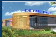
BIELSKO-BIAŁA: ERBUD WKONAWCĄ RETAIL PARK BIELSKO