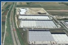
CZĘSTOCHOWA: CENTRUM LOGISTYCZNE NA POHUTNICZYCH GRUNTACH RFG