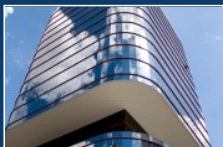
NASTRÓJE W CANNES PRAWIE JAK PRZED KRYZYSEM