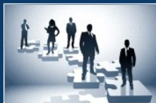
KRZYWIŃ ORGANIZUJE FORUM DLA INWESTORÓW