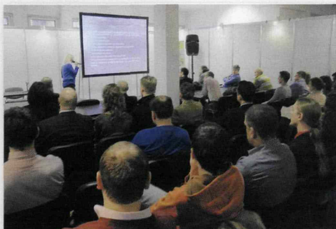
Konsultacje z ekspertami na stoisku Polskiego Klubu Infrastruktury Sportowej