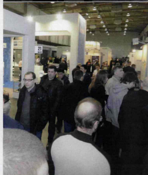
Wykłady eksperckie w pawilonie CBS