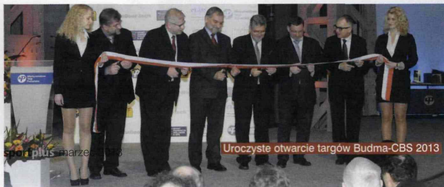
Uroczyste otwarcie targów Budma-CBS 2013