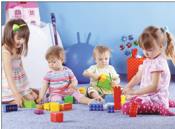
W Krapkowicach w formule PPP z dofinansowaniem z programu „Maluch” powstał żłobek i klub dziecięcy.

zapis o warunkowym zawarciu umowy o PPP jedynie w przypadku pozyskania wsparcia finansowego.